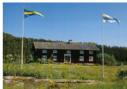
Purala Finngård Röjdåfors

Purala är en av de största rökstugorna i Värmland och ligger vid sjön Röjden. Rökstugan , byggd 1808 , är den ursprungliga delen och en svenskstuga är tillbyggd.