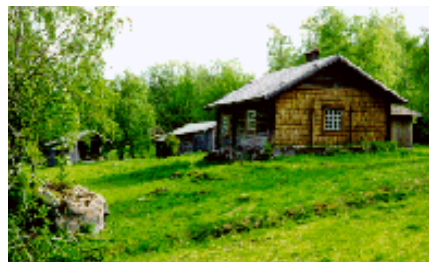
Abborrtjärnsberg Finngård Röjdåfors

Vackert belägen vid Finnskogsleden och området runt husen och inägora är klassade som naturreservat . På en stenhäll nära rökstugan kan man se ett “trollkors” inristat för att skydda mot onda andar.